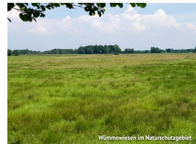
Wümmewiesen im Naturschutzgebiet