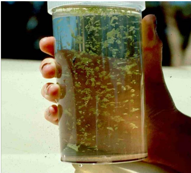
Kolonien von Microcystis

Manche Cyanobakterien wie die häufig vorkommende und blütenbildende Microcystis bilden Kolonien aus vielen Einzelzellen. Diese Kolonien kann man auch schon mit bloßem Auge erkennen.