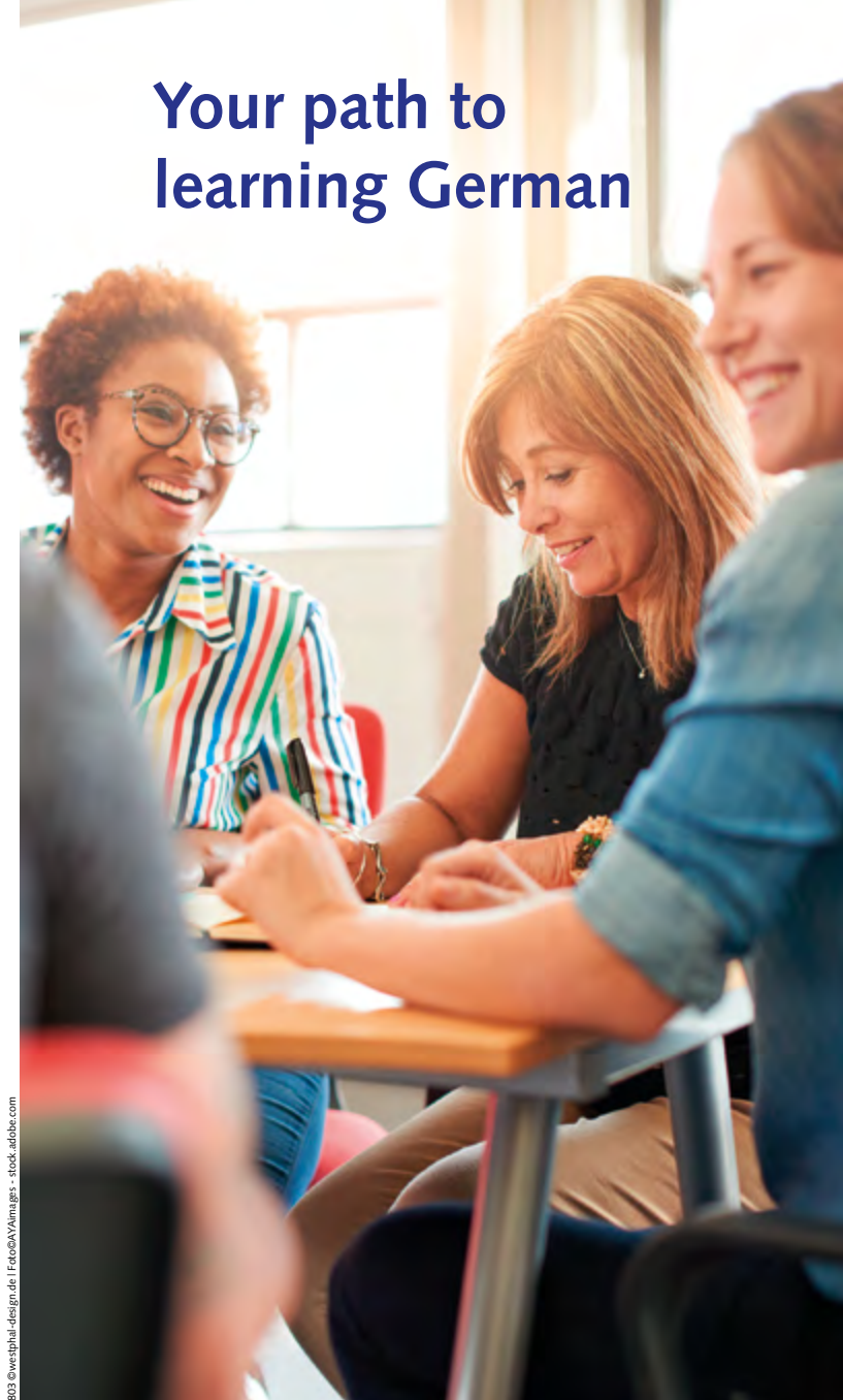
1803 ©vestphal-design.de | Facebook.com/abbe.com