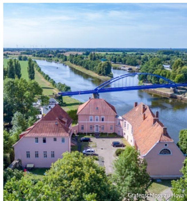
Grafenschloss zu Hoya