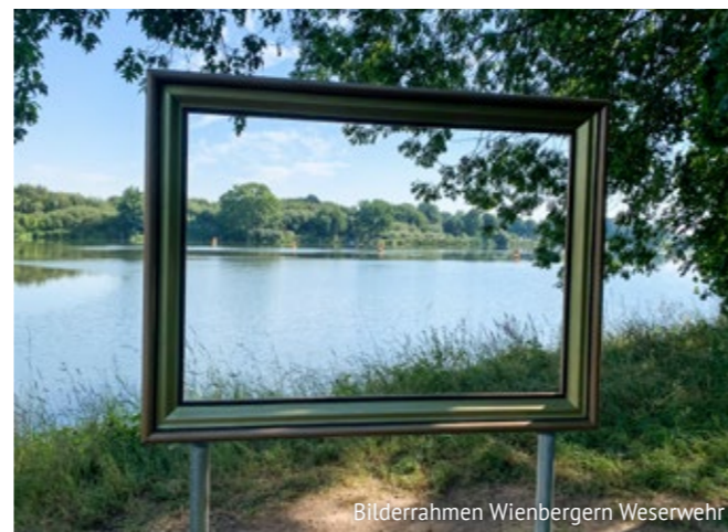
Bilderrahmen Wienbergern Weserwehr