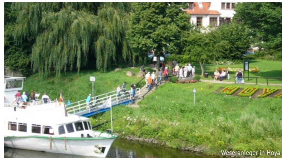
Weseranleger in Hoya