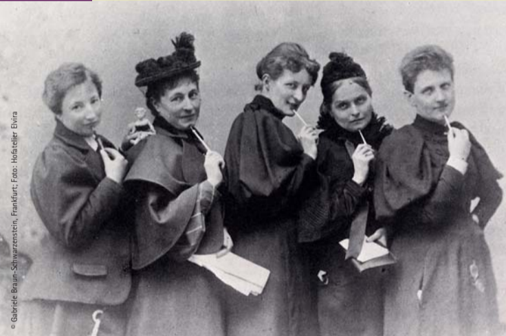
„Radikale“ Damen – Anita Augspurg, Marie Stritt, Lily von Gizycki, Minna Cauer, Sophia Goudstikker (v. l. n. r.), um 1894