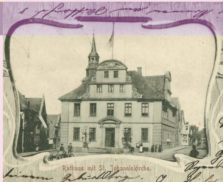
Rathaus mit St. Johanniskirche.

Nur drei Minuten Fußweg entfernt vom Dom und dem Elternhaus Anita Augspurgs bietet das Domherrenhaus – Historisches Museum Verden eine Oase der Ruhe. Der Herrenhof aus dem frühen 18. Jahrhundert bietet kostbare Sammlungen zur Verdener Geschichte, so auch komplette Räumlichkeiten des ausgehenden 19. Jahrhunderts. Hier wurden schon Dokumentationen zum Leben und Schaffen Anita Augspurgs gedreht!